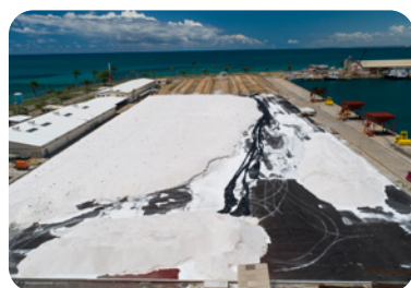
Estoque de sal no porto de Maceió