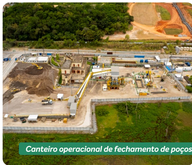
Canteiro operacional de fechamento de poços

As atividades de fechamento dos 35 poços de sal tiveram início em 2020 e seguem o plano apresentado às autoridades e aprovado pela Agência Nacional de Mineração (ANM), que acompanha e fiscaliza os trabalhos. Hoje, 70% do plano já está concluído.