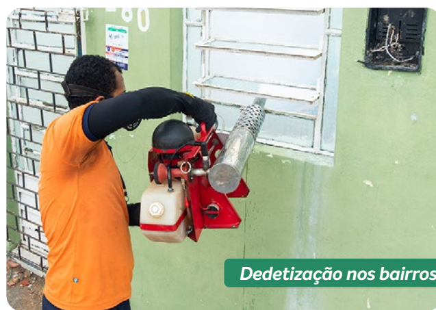
Detetização nos bairros

Ações de limpeza, controle de pragas e vigilância patrimonial, em conjunto com a segurança pública, seguem acontecendo nos bairros.