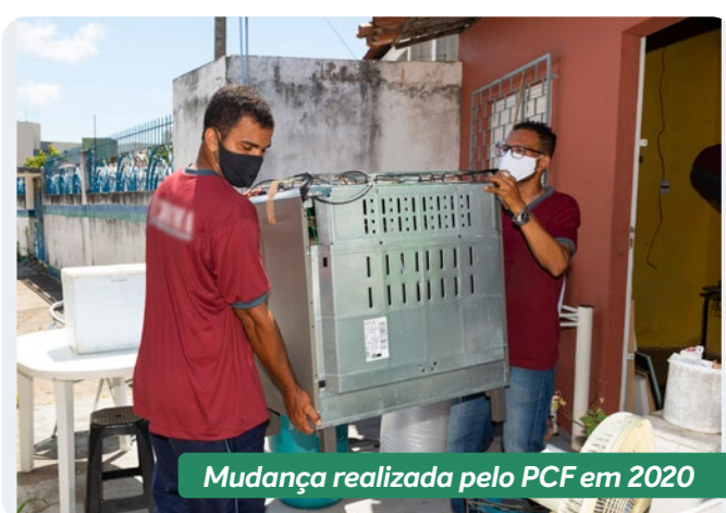
Mudança realizada pelo PCF em 2020

A desocupação preventiva está 100% concluída na área de risco do mapa definido pela Defesa Civil* em 2020. Moradores dos últimos 23 imóveis que ainda permaneciam na região foram realocados pela Defesa Civil no início de dezembro deste ano e a “área de resguardo” está desocupada desde abril de 2020.